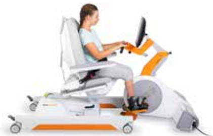
WYTRZYMAŁOŚĆ | SIŁA

Wielofunkcyjne krzesło umożliwia wszechstronny trening dla poszczególnych celów terapii.