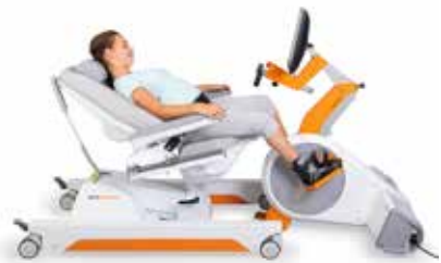
WCZESNA MOBILIZACJA I BIERNY & AKTYWNY ROM