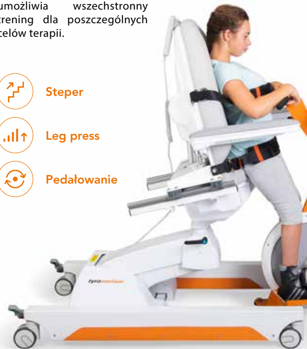
PIONIZACJA | INICJACJA KROKÓW | OBCIĄŻENIE | KONTROLA TUŁOWIA